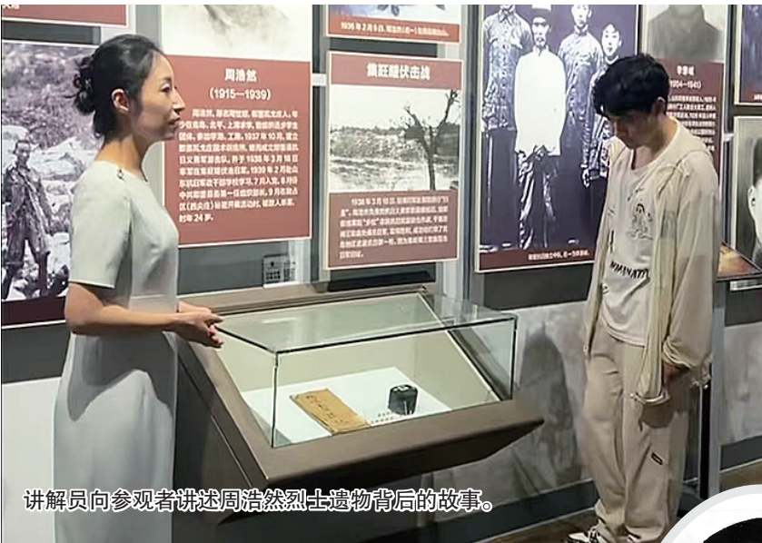
讲解员向参观者讲述周浩然烈士遗物背后的故事。