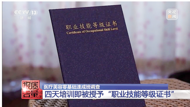
不用考试就能获取所谓的“职业技能等级证书”。

在福州医美培训速成班,开课第一天培训师就开始讲授注射。在培训的4天当中,培训班先教大家如何注射肉毒素、玻尿酸等针剂类产品。两天理论知识培训后,在培训现场,培训师指导学员互相操作针剂注射。在针剂项目之后,培训人员又开始教授具有面部提升功能的线雕手术类项目,并告诉大家如何操作可以更挣钱。