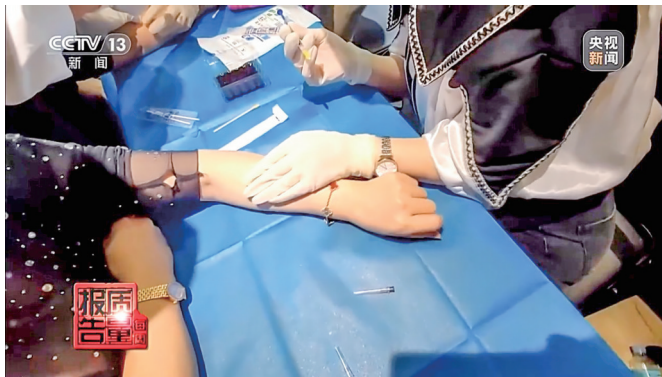
医美培训速成班开课第一天就讲授注射。

根据售课人员推荐的课程表,仅6月份,北京、上海、重庆、天津等20多个城市均开设有这样的速成班课程。售课人员介绍,省会城市每个月都会开班。学员交完一次学费,可以去其中任何一个地点进行无限期免费复训。记者先后参加了福州、广州、深圳等地的培训,上课地点均设在快捷酒店会议室。