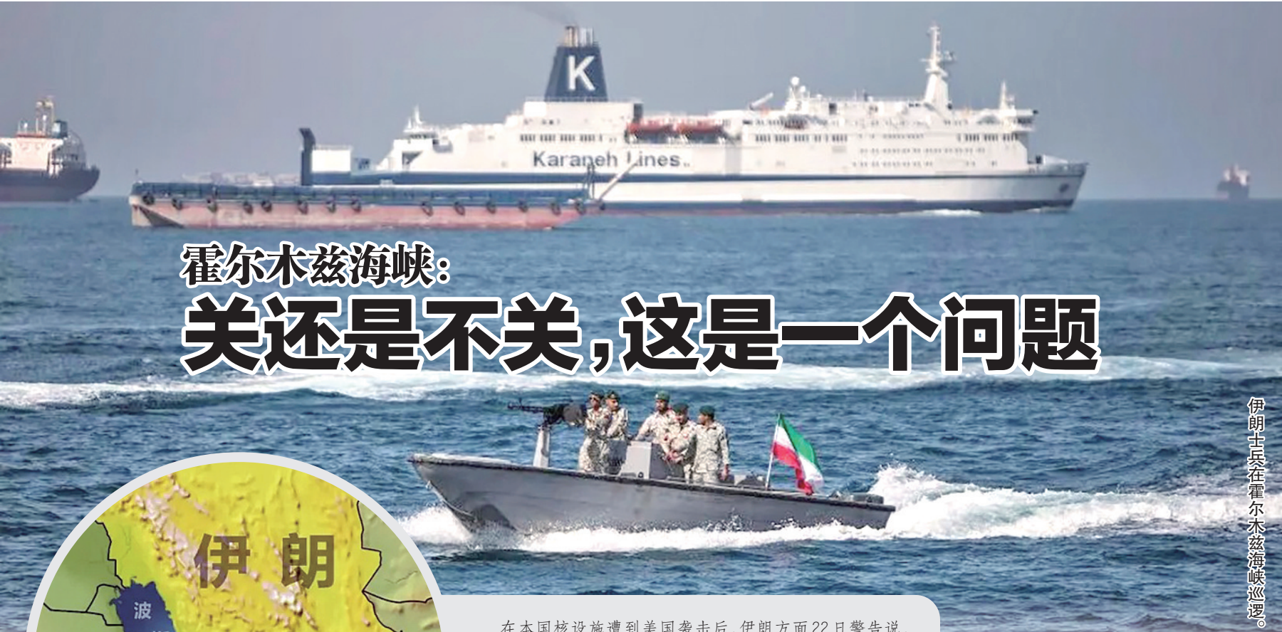
伊朗士兵在霍尔木兹海峡巡逻。