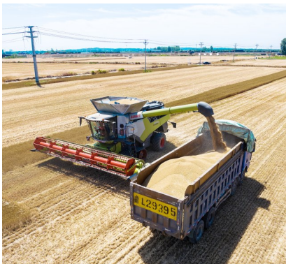
分离出来的麦粒从卸粮筒中倾泻而下。