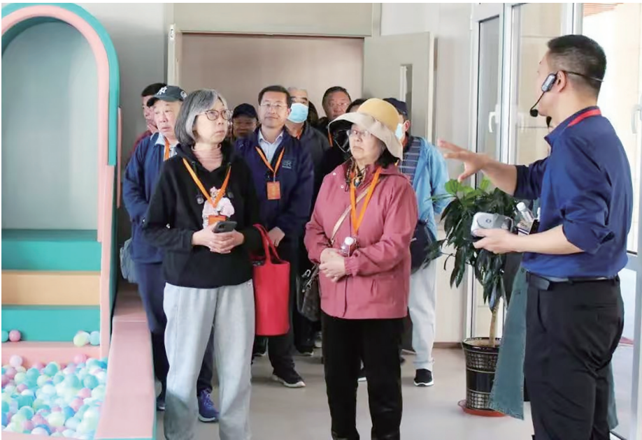
珠山万年颐养社区活动丰富。

在素有“青岛后花园”之称的莱西市,宏远健康颐养中心的桃园东方健康颐养小镇正在打造一所多位一体的宜居养老社区。小镇整体规划分为5个部分:宏远健