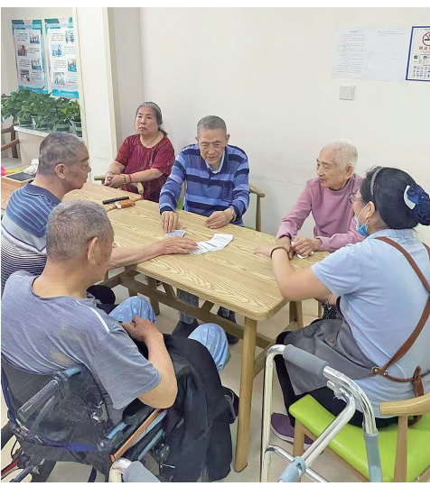
海伦路街道养老服务中心护理员陪老人做游戏。

“一碗汤的距离”是指老人与孩子既拥有自己的空间,又不失亲密的距离。不只是子女煲好一碗汤送去给父母,温度刚刚好的物理距离,更是界定彼此亲密距离的生动比喻。 “一屋不住三辈人”这句老话,近年来频繁被提起。三代同堂看似其乐融融,实则暗藏摩擦。传统大家庭模式逐渐被“抛弃”,背后折射的不仅是代际差异,更是生活方式、价值观的碰撞。当前,三代、四代同住的家庭结构不再是主流,我们或许可以在居家新模式、社区互助、机构康养等多种模式中找到属于每个家庭的温暖答案。