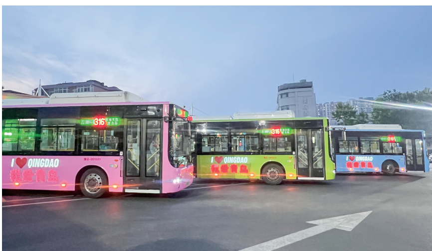
316路“我爱青岛”主题巴士闪耀启航。