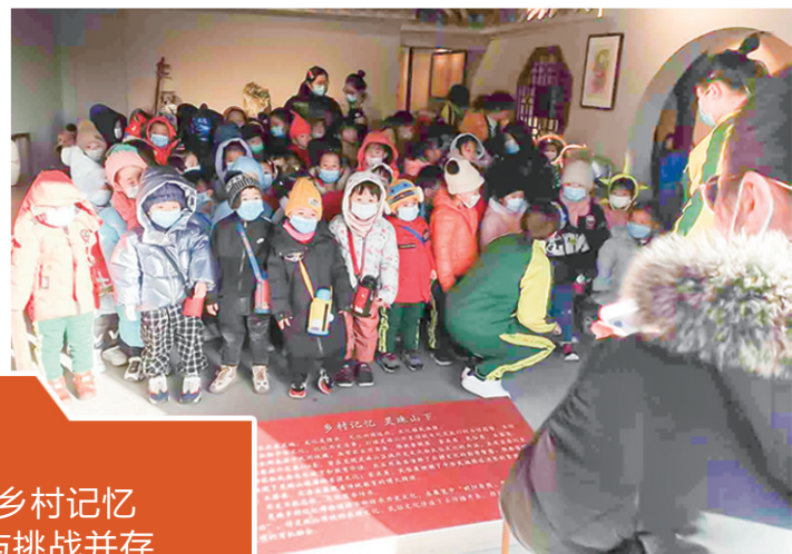
幼儿园师生参观灵珠乡村记忆博物馆。