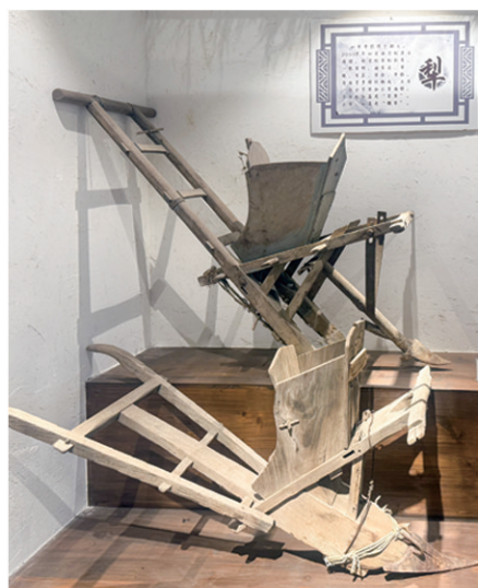
灵珠乡村记忆博物馆展出的犁。

从守护乡村记忆的赤子之心,到面临资金与宣传的困境,再到对未来的美好展望,灵珠乡村记忆博物馆的发展历程,折射出民间博物馆在传承文化过程中所面临的机遇与挑战。它不仅是一座收藏老物件的场馆,更是连接过去与未来的桥梁,承载着创办人对乡村文化的眷恋与传承的使命。希望在未来这座乡村记忆博物馆能吸引更多人了解乡村历史,感受乡村文化的魅力,把乡村记忆文化一代一代地传承下去。