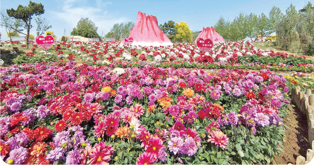
即墨玫瑰小镇3000亩玫瑰花迎来盛花期。