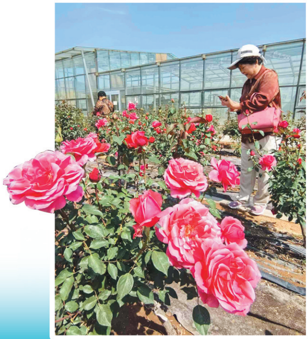
即墨玫瑰小镇的室外玫瑰花迎来盛花期。