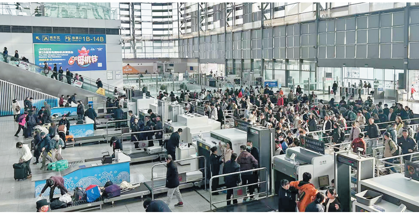
旅客在青岛北站检票乘车。

早报4月29日讯 今年五一假期铁路运输期限为4月29日至5月6日,共8天。节日期间,铁路探亲流、旅游流交织。铁路青岛站(含青岛北站、济青高铁各站)预计发送旅客124万人次,日均15.5万人次,同比增长3.8%。5月1日为客流高峰日,预计发送旅客18.6万人次。省内客流主要以菏泽、临沂、淮