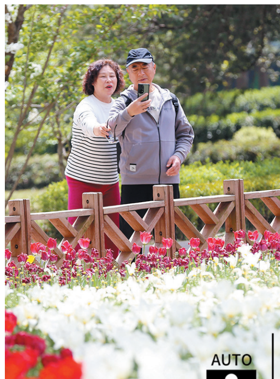
人们徜徉在花海中,感受美好的春天。