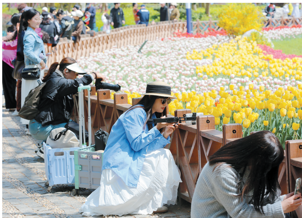
游人在“莫奈花园”里拍摄。