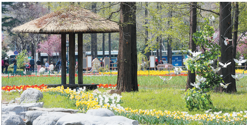
郁金香把中山公园装扮成“莫奈花园”。