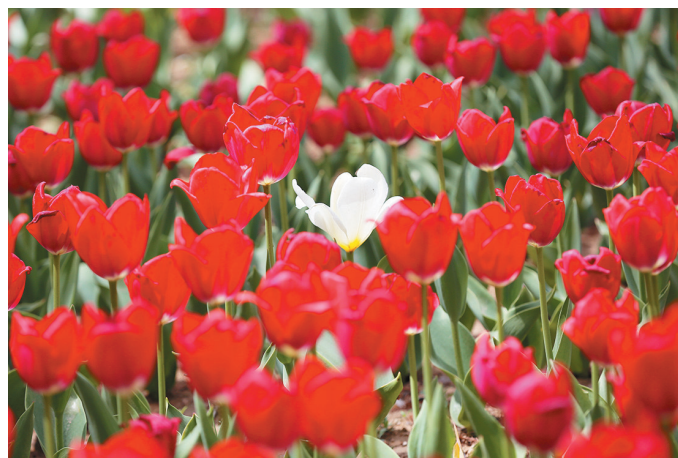
红色花海中,一朵白色郁金香十分夺目。