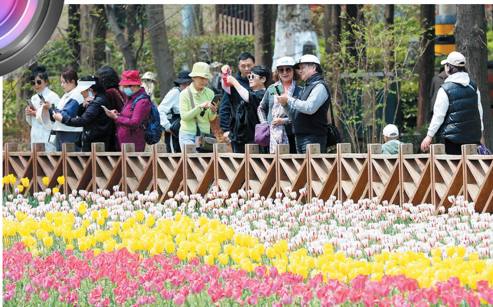
五颜六色的郁金香绚丽绽放,吸引市民游客观赏。