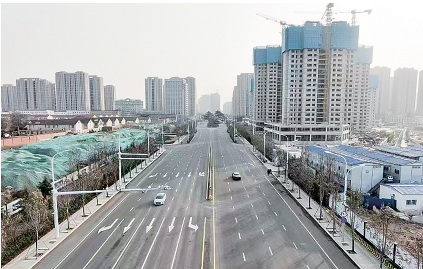
营流路已成为即墨区的城市主动脉。

即墨区跨区出行总量的70%是去往或经过城阳区,同时城阳区跨区出行总量的35%是去往即墨区。目前两区中心城区主要位于洪江河以东、龙青高速公路以西,该区域内共有26条道路需打通,目前11条道路已经连通,15条道路尚未连通。 近年来,两区实施的即墨区天山一路顺接城阳区中城路、即墨区墨城路顺接城阳区靖城路等主干道建设工程,大大减轻了即墨区去往城阳区方向通行压力。2025年即墨区正在实施的营流路顺接城阳区驯虎山路等建设工程,计划2026年与城阳区同步贯通。