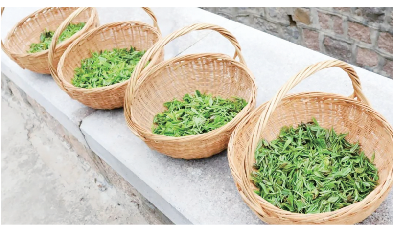
新鲜采摘的崂山茶已成长为“亿元茶业”。(资料照片)

饮企业、精品民宿以茶为媒,现场争“鲜”,为市民游客奉献一场色香味俱全的舌尖盛宴;将通过看、闻、尝等方式举行崂山茶评茶大赛等。