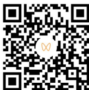
扫码观看相关视频 拍摄/剪辑 纪宣呈

早报 4月15日讯 4月16日是世界噪音日。4月15日,青岛城运控股公交集团李沧巴士公司213路公交车驾驶员江世纪打造“静音车厢”,通过形式多样的活动,倡导市民“静”享公交,引领文明出行新风尚。