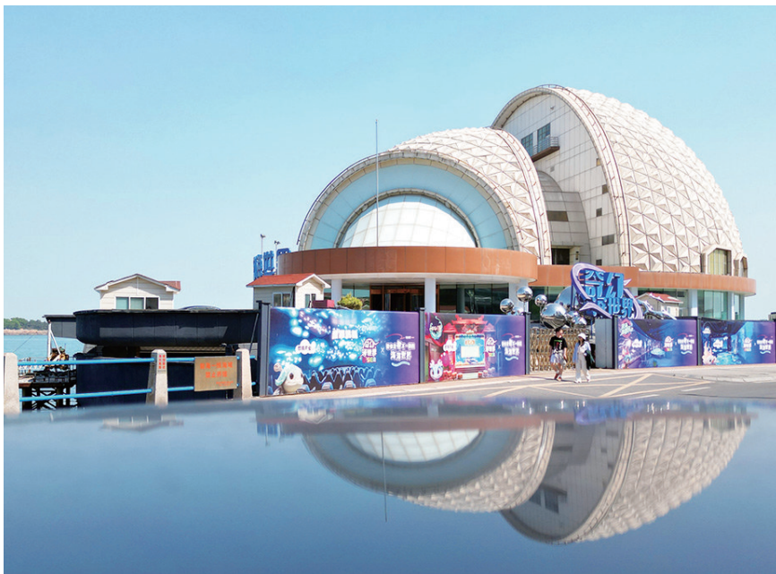
海上皇宫将改造提升。

海上皇宫形如一个白色贝壳,因其独特的地理位置以及别致的造型一直备受关注。海上皇宫始建于1994年,1996年建成并开始营业,建筑面积11000平方米。海上皇宫发展历程多以酒店餐饮业态为主,后皆因经营不善,停业“沉睡”10多年。2018年重新清理翻新,2019年曾运营“故宫青岛文创馆”。2022年8月,金东数创和青岛海明城市发展有限公司接手海上皇宫项目,经历了负一层