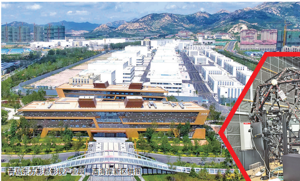
青岛东方影都影视产业园。

《封神第二部》《蛟龙行动》闪耀春节档 青岛影视基地拍摄制作作品累计票房383.6亿元