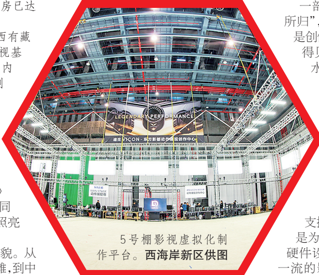
5号棚影视虚拟化制作平台。

认证符合国际标准的大型影视拍摄制作基地,为科幻电影和工业大片的拍摄制作提供了有力支撑。