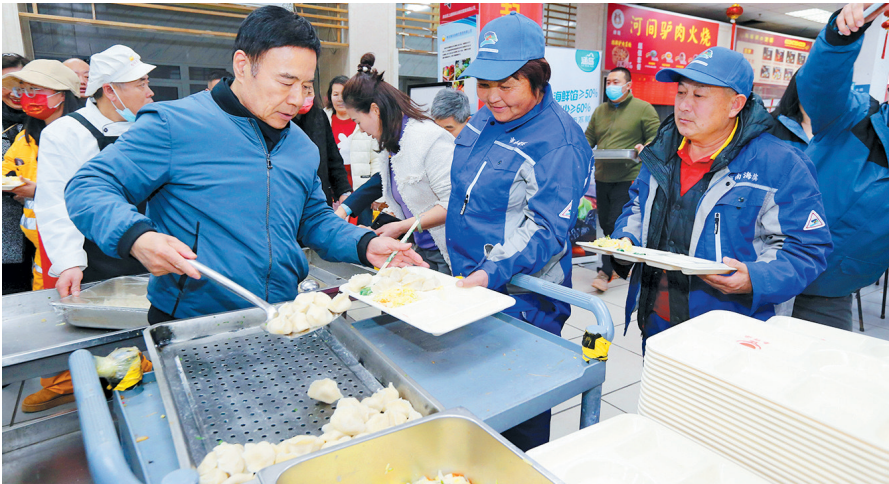
志愿者为坚守岗位的一线工人盛水饺。

盘里。这些人当中,有在城市街头不畏严寒坚持工作的交警,有披星戴月清洁城市的环卫工人,有守护社区居民安全的民警及社区工作人员,有为别人送餐送快件的跑腿一族。志愿者们为他们送上热气腾腾的饺子,表达对他们坚守岗位的敬意。他们脸上露出了欣慰的笑容,一位来取餐的跑腿小哥感慨地说:“虽然春节期间不能回家和家人团聚,但能在自己的岗位上收到这份温暖,心里特别感动。”