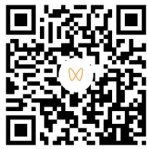
扫码观看相关视频