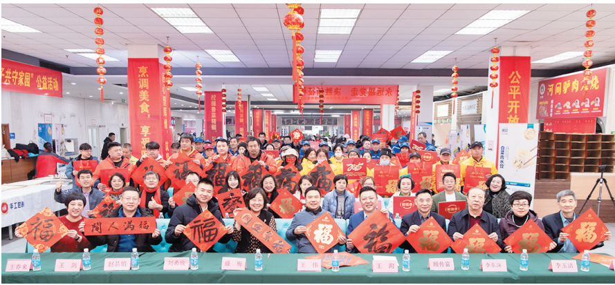
1月22日,“爱心青岛好客山东 一碗饺子共守家园”公益活动启动。

来自青岛市慈善总会、市总工会和爱心企业的数十名志愿者早早来到活动现场,他们分工明确,有的负责准备食材,有的精心布置场地。大家齐心协力,红红的灯笼、喜庆的福字和春联将活动现场装点得充满节日气氛,场地一侧是大大白案板上的饺子整齐排列,另一侧妙笔挥毫、墨香四溢,处处洋溢着浓浓的年味儿。志愿者们手法娴熟,不一会儿,一个个饱满圆润的饺子就摆满了案板。在泰祥源美食广场摆放的餐桌上,腊八蒜、小凉菜和米醋蘸料等应有尽有,志愿者们将煮好的饺子依次送到每位岗位坚守者的餐