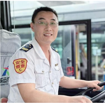
326 路线驾驶员 郭代弟 十米车厢暖人心 用心服务无终点

陈光胜是青岛城运控股公交集团市南巴士公司 321 路线的一名驾驶员。作为一名中共党员、班组长,他始终坚持“热心、真心、诚心、爱心、耐心”的服务宗旨,行车途中处处体现出对乘客的细微关怀,每到一站,他都会提醒乘客上车要扶好、注意安全。他在公交驾驶舱坚守了 7000 多个日日夜夜,对乘客服务始终如一,做到安全无事故、乘客无投诉。