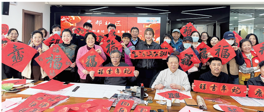
“我们的中国梦——文化进万家”迎春送福活动。

自1月6日起,金家岭街道以“文化金家岭 非遗贺新春”为主题,组织书法家陆续走进山水名园、颐都、东城国际、惠都及锦园等多个社区,开展了“新春送福到身边 书香墨趣满家园”暨“我们的中国梦——文化进万家”迎春送福活