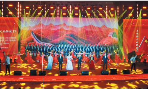
青岛一中迎来百年校庆。