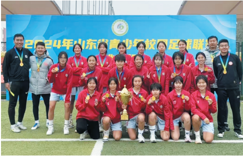
青岛九中礼贤女足获省冠军。