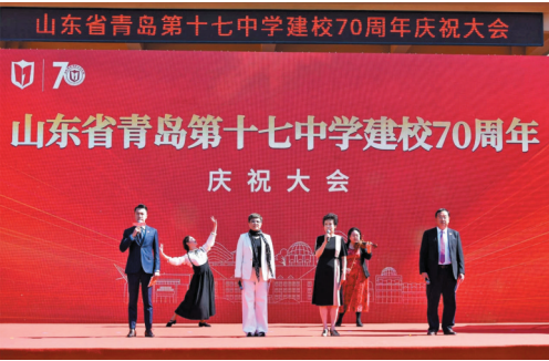
青岛十七中70年校庆。