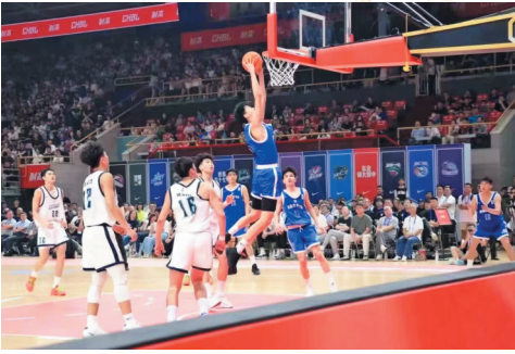
青岛六十七中男篮获全国高中篮球联赛亚军。