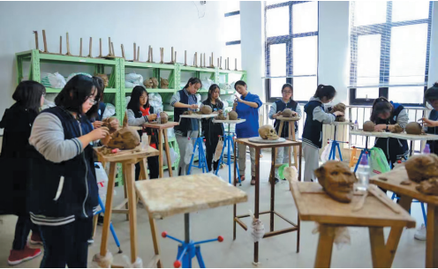
青岛六中获“青岛市美育特色学校”称号。