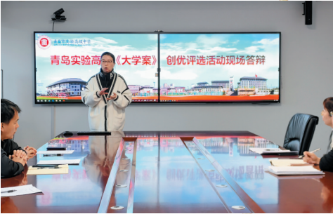
青岛实验高中新人文教育成果显著。