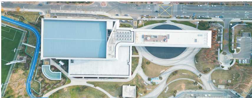
致力于打造一流硬件设施。