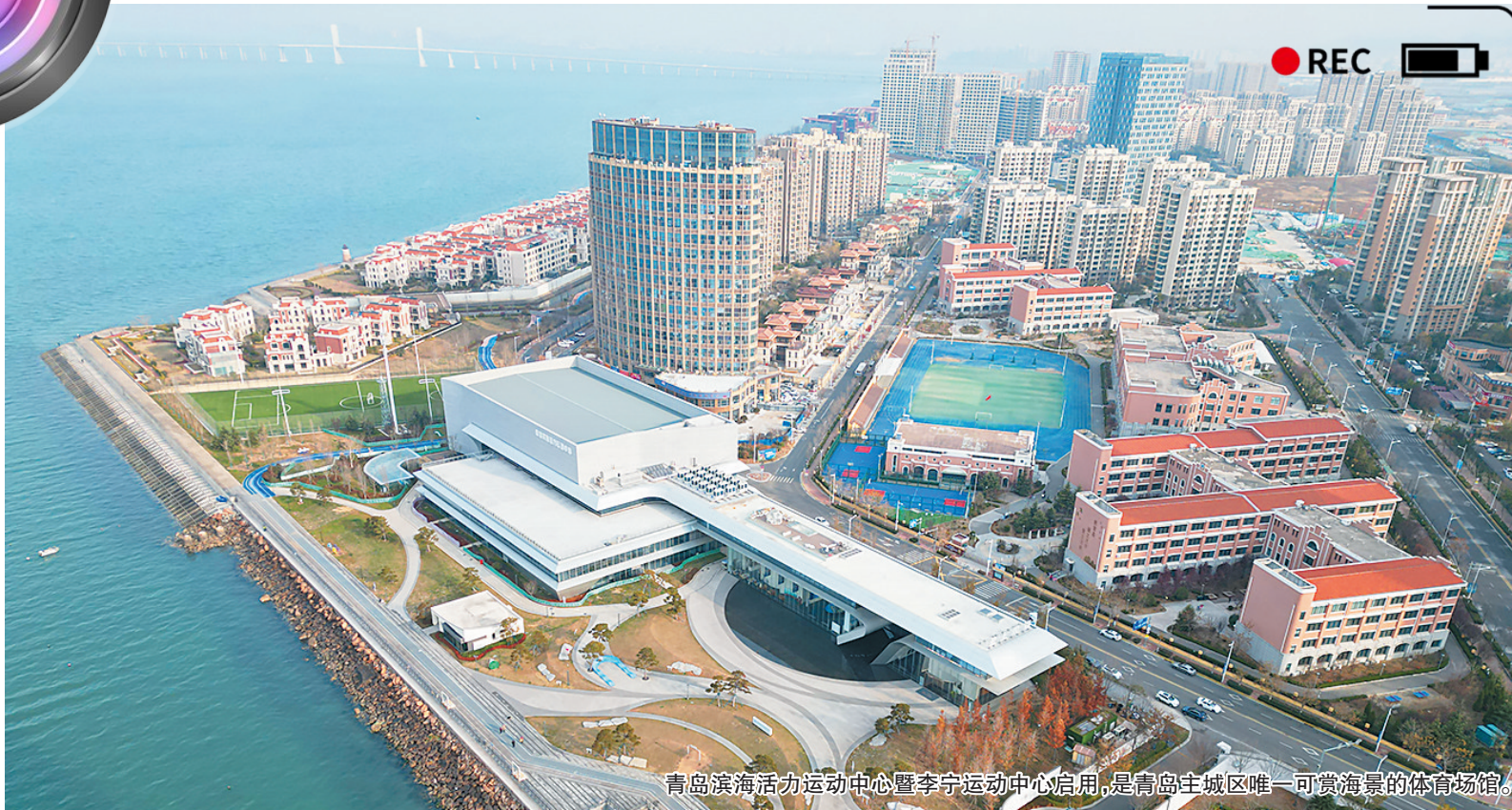
青岛滨海活力运动中心暨李宁运动中心启用,是青岛主城区唯一可赏海景的体育场馆。