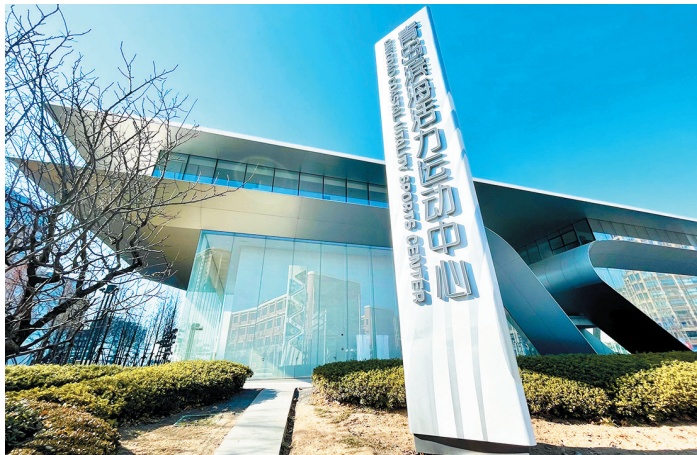
将开展全民健身活动、赛事。