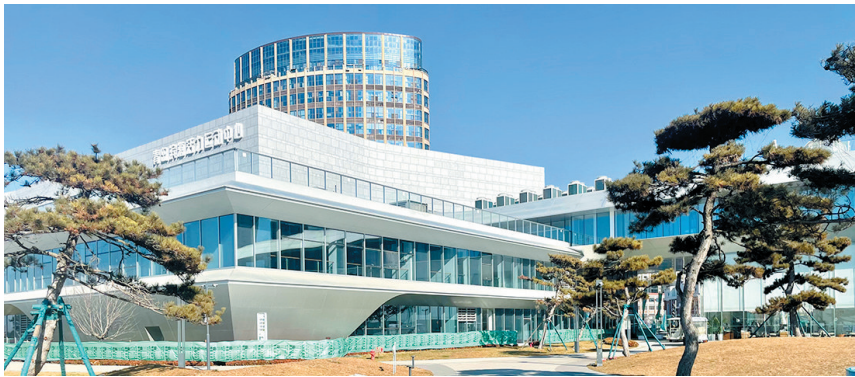
运动中心周边环境优美。