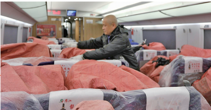
青岛北站至郑州航空港站高铁快运专列装满快件即将首发。

青岛北站至郑州航空港站高铁快运专列的开通，为高铁快运业务注入了新的活力。据中铁快运济南分公司相关负责人介绍，此次开通的青郑高铁快运专列，是铁路部门积极响应市场需求，提升物流服务效率的重要便民举措。主要服务于生鲜食品、生物医药、电子产品等批量运输需求，同时满足当地企业、电商快递乃至个人客户商务急件、文书信函等时效要求比较高的物品快速传递。此专列充分利用了高铁速度快、运行稳定的特点，将青岛与郑州之间的物流时间缩短至3个半小时，开辟了胶东到中原地区高铁运输的新快速通道。