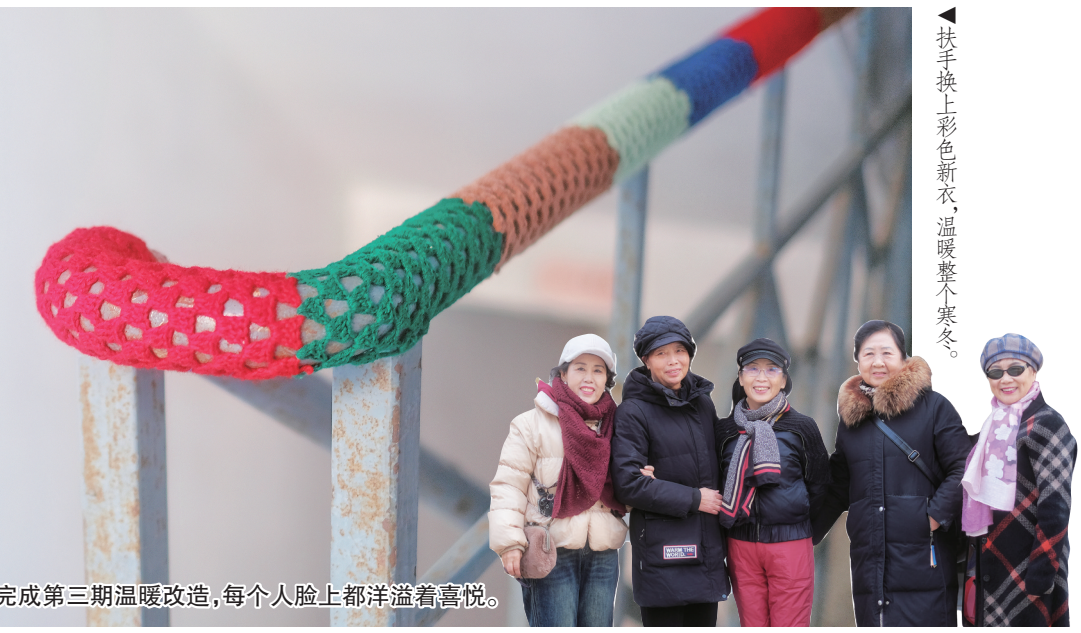
▲扶手上换上彩色新衣,温暖整个寒冬。