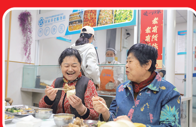
河南庄社区老年人在助老食堂用餐。