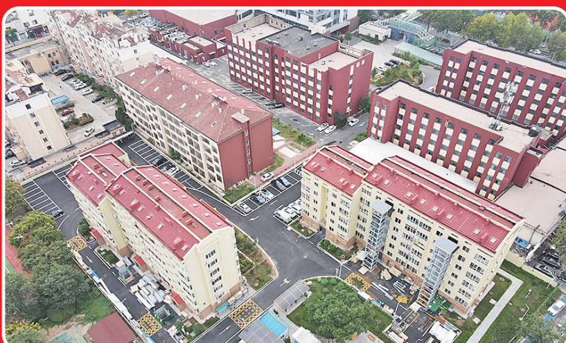
城阳区改造后的聚德苑小区。

完成情况: 2024年,全面取消职工普通门诊定点签约的规定,实行门诊自由就医,在职工在基层(含一级)、二级、三级定点医疗机构门诊报销比例分别提高至80%、70%、60%,退休人员相应提高5个百分点。在职工、退休人员