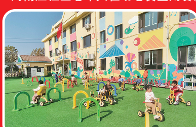
莱西市一所幼儿园改造后焕然一新。