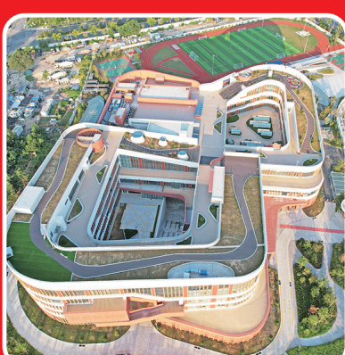
崂山区深圳路小学建成投用。