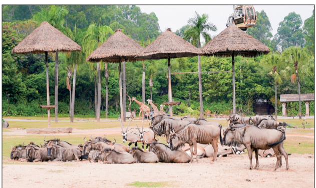
长隆野生动物世界。