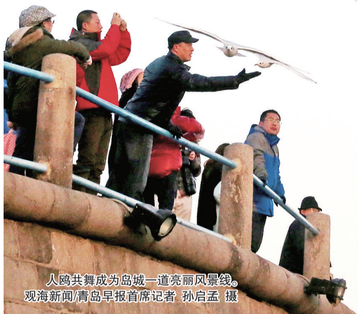
人鸥共舞成为岛城一道亮丽风景线。

每年秋末冬初,人鸥和谐共处的画面成为岛城一道亮丽的风景线。为助力岛城冬季文旅消费,青岛日报报业集团、青岛市园林和林业局等单位联合推出了“鸥遇青岛”——青岛市首届海鸥文化节,贯穿全年的一系列“人鸥同乐”活动为市民游客呈现一场极具岛城特色的文化盛宴,成为岛城又一火爆出圈的节庆IP。