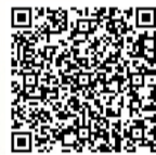
“青小鸥”网络投票二维码