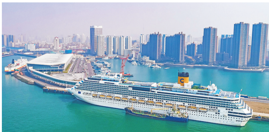
停靠在青岛国际邮轮母港的邮轮。资料照片

今年8月20日,“蓝梦之歌”号邮轮在青岛开启首航,首航航次以近满载的游客上座率运营了7天6晚的日本品质