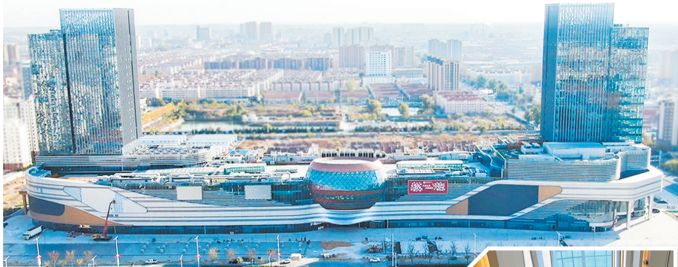
组图:莱西王府井购物中心将于本周六开门纳客。

据介绍,莱西王府井购物中心项目定位为“城市品质生活新坐标”,以时尚、精致、年轻品牌为主导,配合多家城市首店、旗舰店、特色餐饮及跨