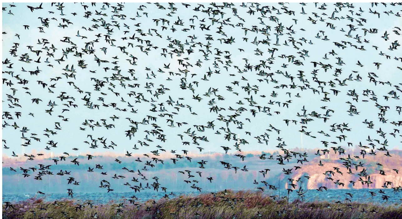
12月7日,上万只野鸭在莱西湖掀起“鸟浪”。

初冬时节,莱西姜山镇的万亩湿地和莱西湖便成了鸟类的天堂,数以万计的鸟儿在芦苇丛中栖息、飞翔。作为胶东半岛最大的内陆湿地,姜山湿地生物多样性丰富,引来了不少珍稀鸟类栖息。12月7日,上万只野鸭在湿地上空翩翩起舞,场面十分壮观。