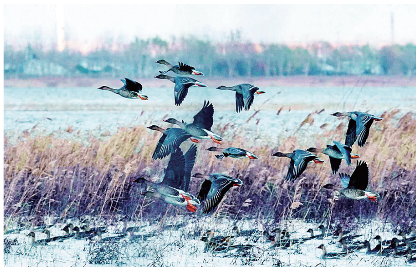
野鸭群飞过芦苇荡。于考臣 摄

这两年,产芝水库(莱西湖)迎来了一群尊贵的客人——白天鹅和丹顶鹤。摄影爱好者在这里连续多年拍下了一组组珍贵的照片。随着莱西市全域河道生态环境治理成果日益显著,前来越冬栖息的鸟儿成倍增加,有大雁、白鹭、大天鹅、灰鹤等240多种,莱西湖以及大沽河流域重新成为鸟类栖居的“家园”。