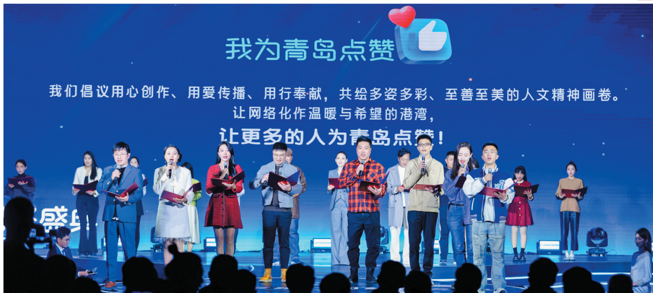
网红天团创意宣言“我为青岛点赞”。

凡人微光，星火成炬。无数的网络正能量和网络好声音，接力传递城市之光，汇集温暖与大爱。此前，市委网信办组织开展了“青岛市 2024 年网络优秀项目征集”活动，聚焦青岛重要网络文明事件和城市发展重大议题。活动自开展以来，涌现出一大批优秀新媒体账号，创作出一大批优秀互联网作品。最终，经专家评审委员会初评、终评、公示等环节，各大奖项一并在盛典现场揭晓。《片警老马的 46 把钥匙》《节气绘青岛——二十四节气里的青岛》系列短视频、《中国人的爱国情怀在此刻具象化了》……一个个感人至深的瞬间，见证青岛这座城市的温暖。