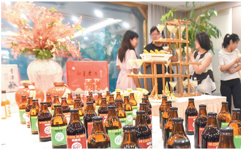
即墨老酒生产的首款气泡黄酒。资料图片

本次入选“青岛优品”名单的产品除了人们熟知的崂山矿泉水、花生油等经典产品,还有许多近期才走入大众视野的新产品,如食品饮料类入选的银杏叶精、自加热黄酒,智能家电类入选的磁悬浮离心式中央空调等,这些产品以其独特的创新性和实用性赢得了市场和消费者的青睐,不