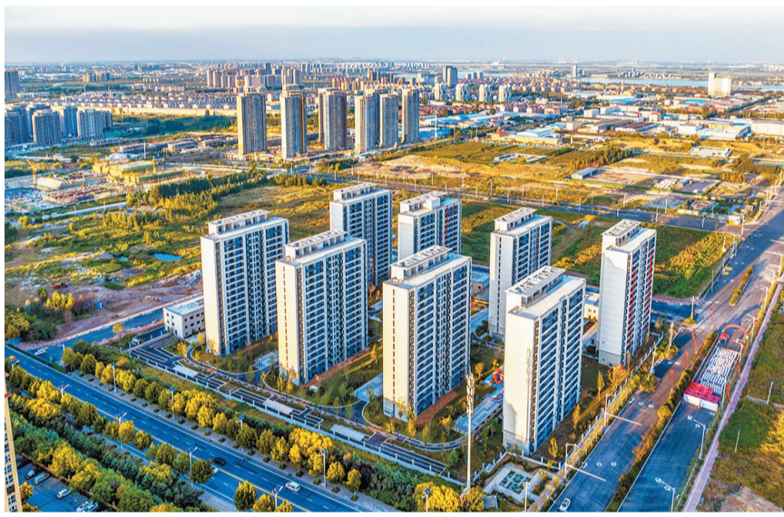
刘家岭、匙家庄安置区改造后。

约项目236个,其中50亿元以上项目5个,与省部共建的上合组织生态环保创新基地、上合国际免税城等一系列重点项目先后落地。益海嘉里二期等206个重点项目加速建设,168个建设类重点项目全部开工。