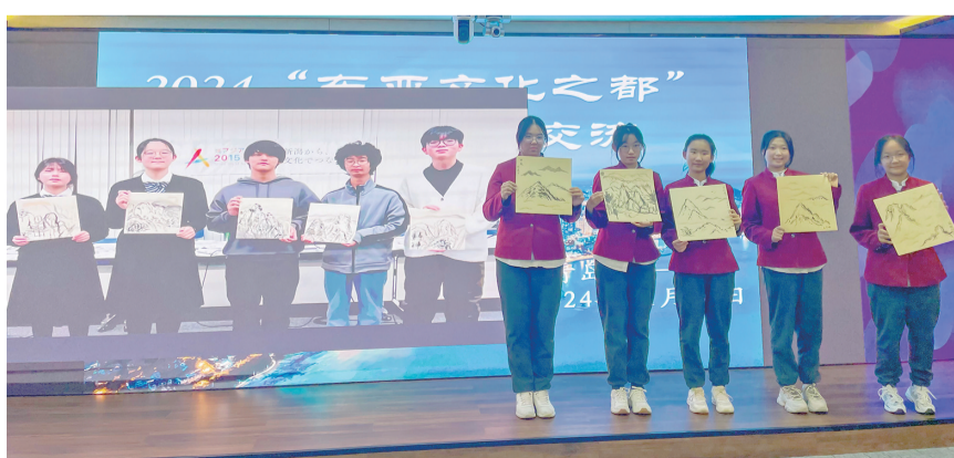
中日学生线上交流。