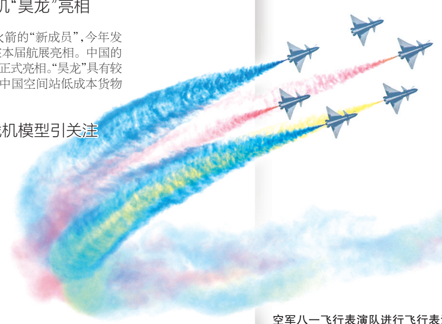
空军八一飞行表演队进行飞行表演。