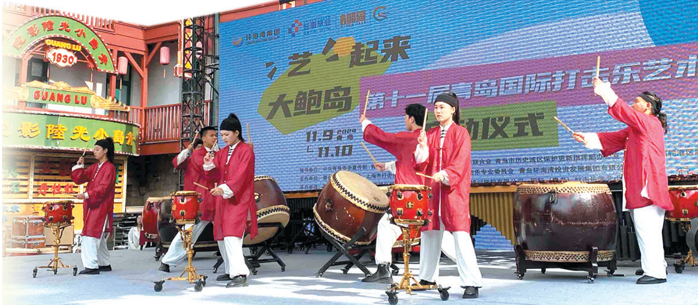
第十一届青岛国际打击乐艺术节演出现场。

启动仪式上,城阳区白沙湾学校、正阳路小学分别演奏了马林巴交响《红旗颂》和《梁祝》,青岛(国际)打击乐演艺中心带来了行进·桑巴、非洲鼓等各具特色的打击乐表演,随后行进乐团、桑巴乐团进行街区巡游,为大鲍岛历史文化街区增添了浓厚的艺术氛围。接下来,行进、桑巴队伍还将在即墨路路口定点演奏,并游行进入博山路广场、易州路广场进行定点演奏,最终汇集至广兴里大舞台,