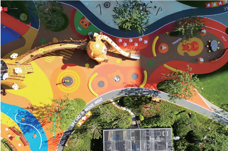
银丰·玖玺城二期珺府品质社区环境。