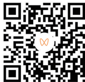
扫码观看品质好房