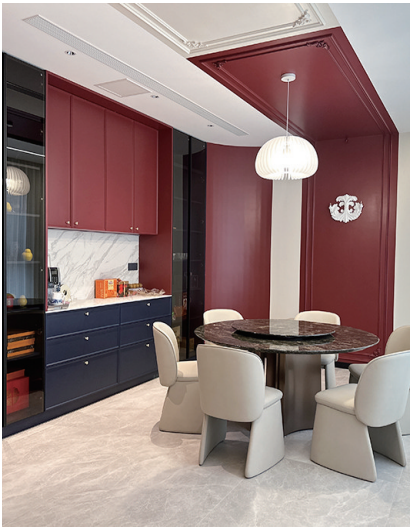
样板间实景图。

“要为客户带来价值感,要为业主打造美好的幸福家。作为现代家装行业,这是势在必行的使命。到目前为止,东方家园已经在青岛走过了24个春夏秋冬,今年10月荣获了‘2024中国家装行业百强装企’,这是东方家园全体同仁共同奋斗的结果,也是所有业主对东方家园的信赖。作为岛城家装行业头部企业,一路走来收获颇多。”东方家园董事长王建华告诉记者,在她看来,家装行业错综复杂,很多从业者很难在一家业主身上看到长期的回报,由此也导致