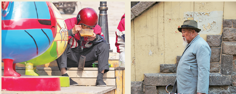
组图:任锡海摄影作品。受访者供图