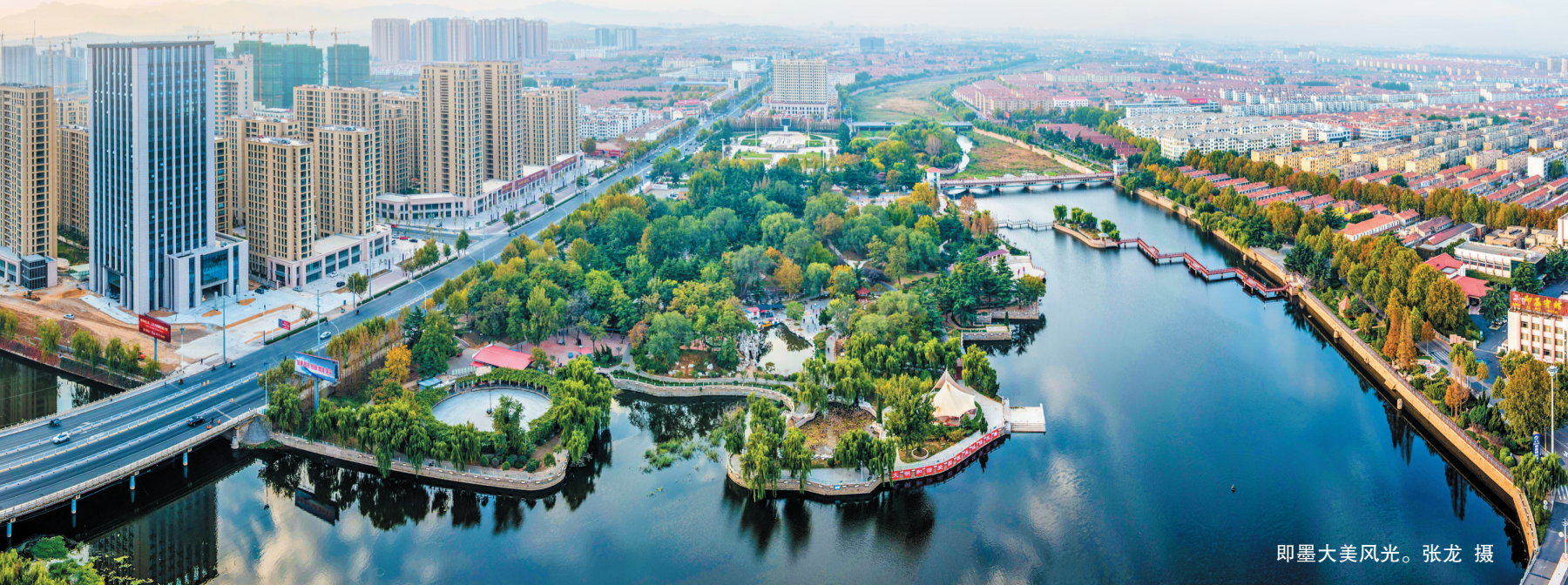
即墨大美风光。张龙 摄

人居环境改善了、道路交通顺畅了、口袋公园焕新了……一处处“看得见”的变化,一项项“摸得着”的幸福,生活在即墨,市民处处见新意,时时有惊喜,真切感受到了家门口“触手可及”的美景和“近在咫尺”的幸福。本版撰稿摄影(除署名外) 观海新闻/青岛早报记者 康晓欢 通讯员 高文莉 庞心怡