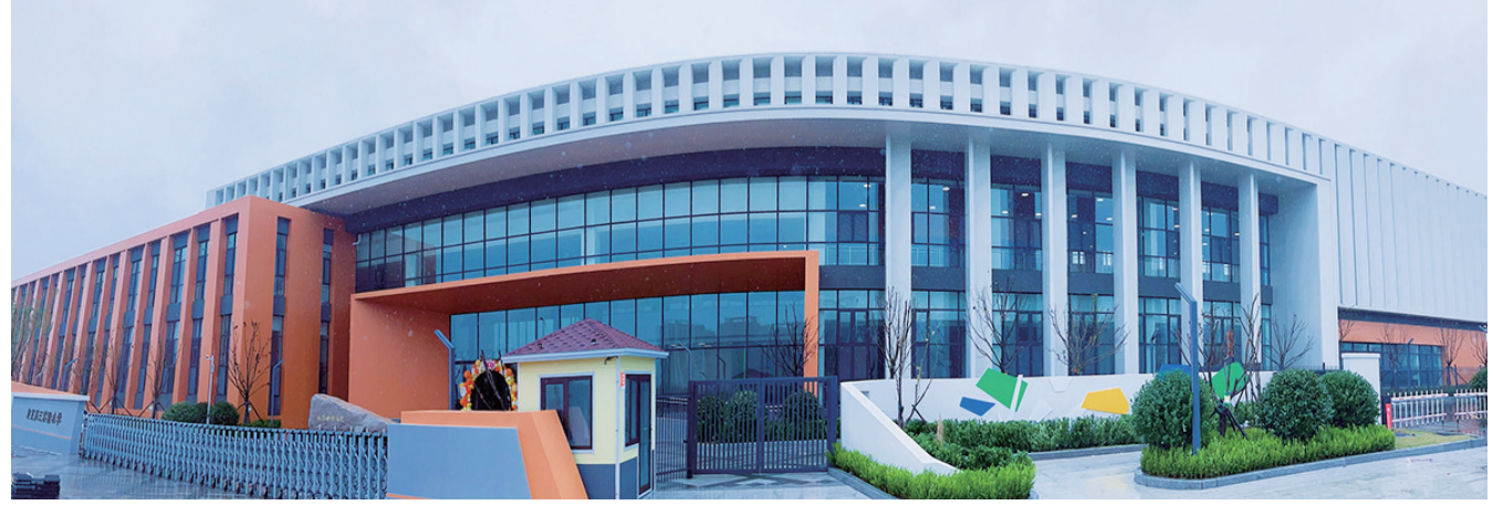
即墨区第三实验小学惠欣路分校。