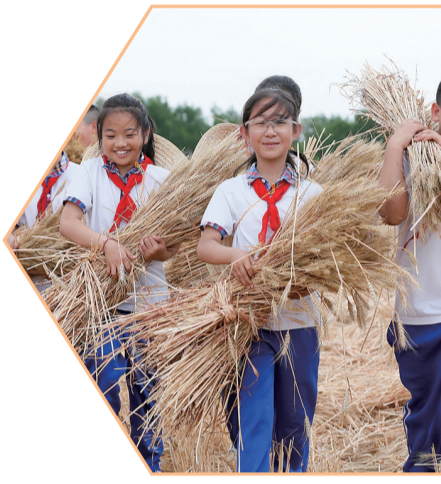
学生参加麦收劳动。

新建及改扩建75处中小学、幼儿园,增加学位5万多个;全区幼儿园公办率提升至61%,普惠率达到98%,全面解决“入园难”“入园贵”……近年来,青岛市即墨区围绕建设活力宜居幸福现代化新区,坚持把教育作为重大民生工程之一,不断优化完善政策、机制,全区教育发展驶上“快车道”,跑出“加速度”。