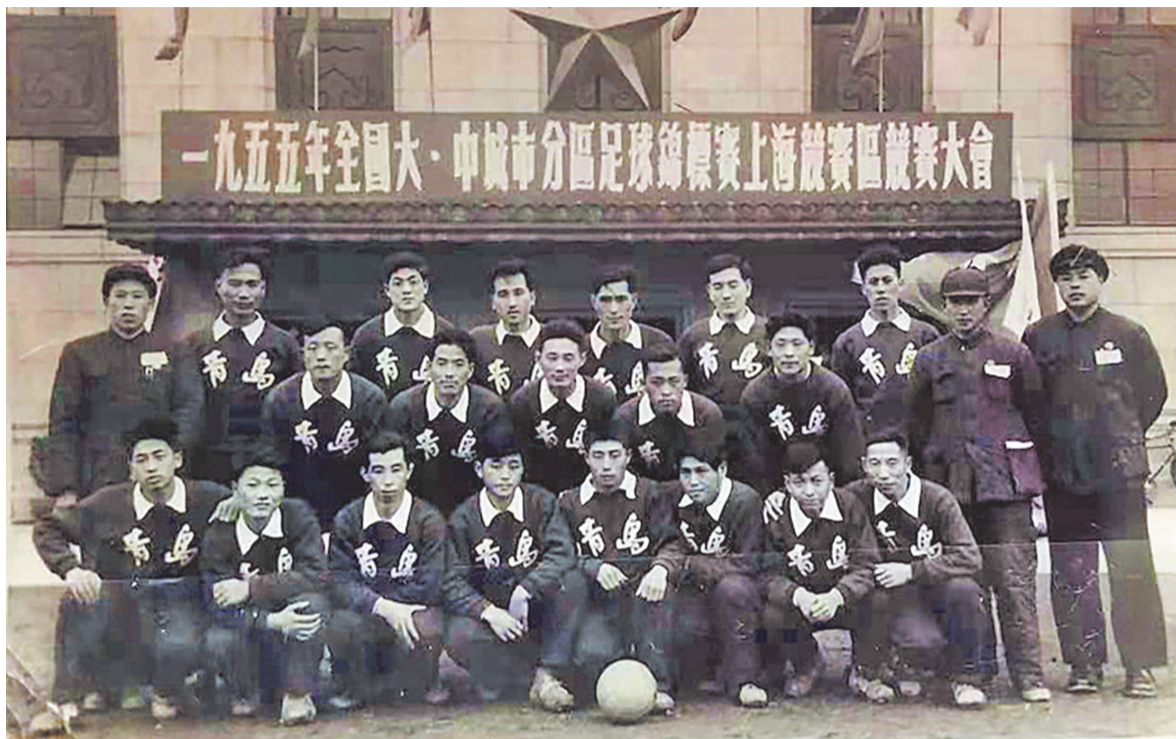
青岛队夺得1955年全国大中城市分区足球锦标赛冠军。

10月19日,2024青岛职工足球超级联赛在青铁体育乔伦运动公园激情开赛,来自全市各行各业的72支代表队1000余名职工运动员在绿茵场上比拼脚法。首届“青岛工超”的启幕使百年“足球城”青岛的群众足球赛事实现了全覆盖,也是1955年青岛市总工会首次举办职工足球比赛之后,青岛职工足球开启了新篇章。为深入挖掘青岛职工足球近70年的历史,本报推出《“工人力量”闪耀青岛绿茵场》系列报道,全面展示青岛职工足球的辉煌和风采。