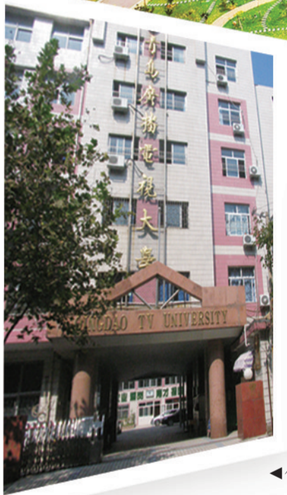
▲位于大连路16号的青岛电大第一校舍。▲学员在上课。