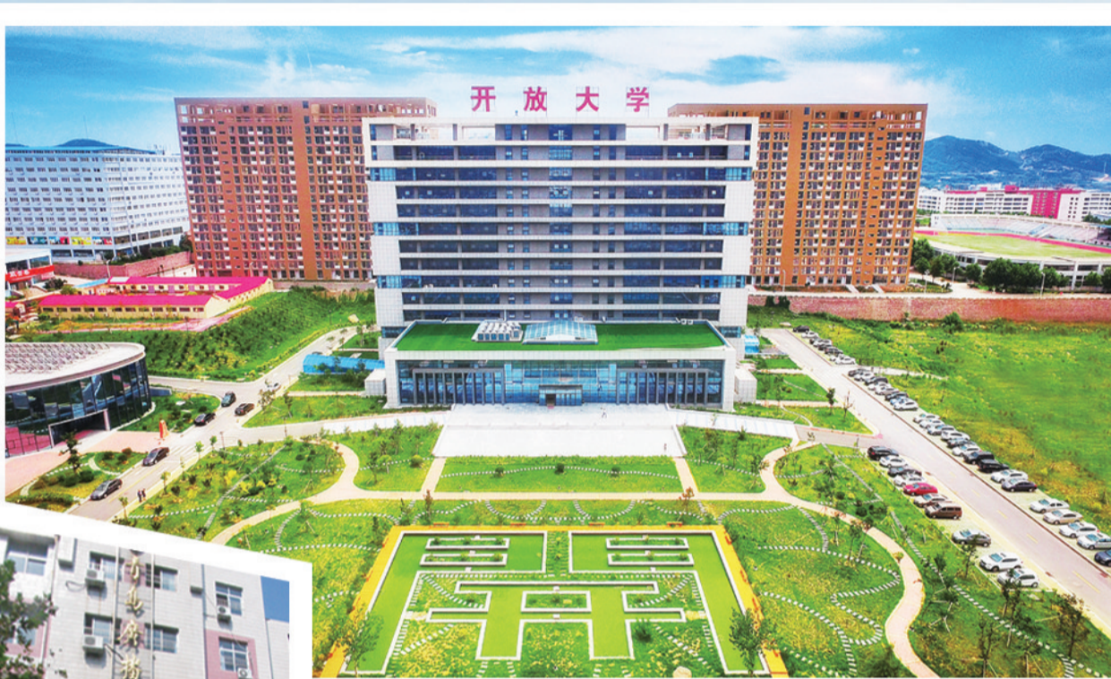
▲青岛开放大学金水路校区。

这是一所“没有围墙的大学”，从乡村干部到车间工人，从快递小哥到军官士兵，学生们来自各行各业；这是一所“跨越时空的大学”，从“空中课堂”到“云端大学”，办学与信息技术始终密不可分……今年是青岛开放大学办学45周年，10月29日上午，青岛开放大学办学45周年座谈会在金水路校区隆重举行。来自市教育局、市人社局等部门，市邮政管理局、中国联通青岛分公司等合作单位，青岛恒星科技学院、青岛幼儿师范高等专科学校等高校相关领导，青岛开放大学离退休干部代表、光荣在校30年教职工代表、杰出校友代表、办学体系各分校和学习中心负责人等近200人参加座谈会，共同回顾学校45年光辉历程，总结办学育人成果，开启奋进新征程、建功新时代的美好未来。