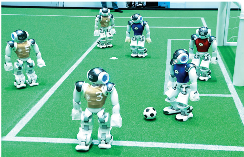
2024亚太机器人世界杯青岛国际邀请赛现场。

本次大赛包含5大项9个分赛项,涵盖RoboCupSoccer人形足球机器人、RoboCupSoccer足球机器人标准平台、RoboCup@HOME家庭服务机器人、亚太机器人世界杯CoSpace赛项、青少年机器人世界杯(RoboCupJunior, RCJ)机器人救援赛项。本次赛事还重点推出了人形机器人赛项,傅利叶智能、加速进化、宇树机器人等机器人领军企业现场展示了最新