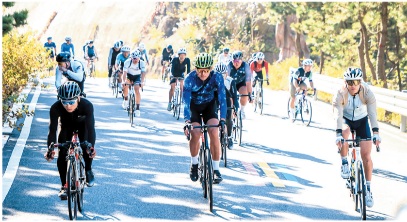
2024“山海骑遇”自行车爬坡赛在崂山开赛。

记者在现场看到,清晨7点左右,参赛选手便陆续到达活动现场,开始了赛前热身准备工作。活动开始进入倒计时,起点线上,一辆辆色彩斑斓的自行车犹如即将离弦之箭,静待发令。随着一声令下,比赛正式开始,选手们骑着自行车穿梭于蜿蜒曲折的山路之间,你追我赶,奋力冲刺,展开了一场体能和意志力的较量。赛场外,道路两旁的美景与选手们拼搏的身影交相辉映,形成一道亮丽的