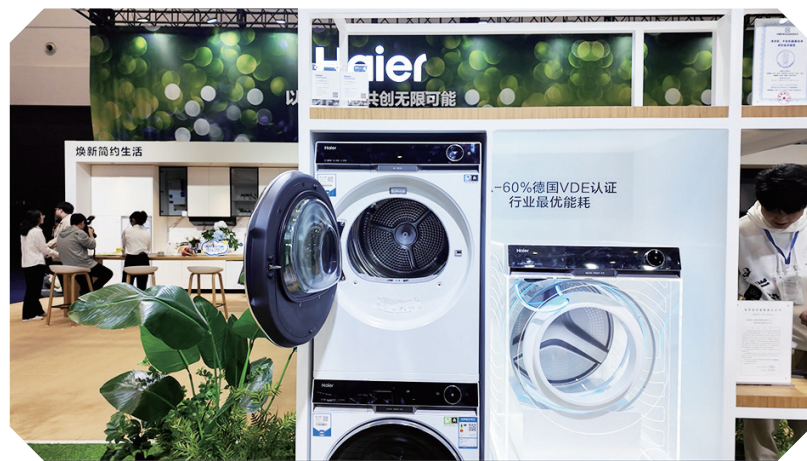
海尔洗衣机具有自动换风功能。

让电视变成一幅画,似乎并不是太难做的工作,毕竟多年前就曾经出现过电子相框。但实际上要做到以假乱真,并不容易。技术人员介绍,首先需要对电视的屏幕进行升级,“电视屏幕需要使用哑光材质,否则会出现反光的效果,但这种哑光材质还不能影响正常的电视显示功能,所以第一步就非常具有技术含量。”工作人员表示,除了这些,电视的显示效果还必须在细节方面做到完美,否则也会出现“像素点”,达不到完美融合的效果。这些海信都已经做到了完