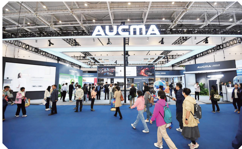
澳柯玛展台新产品很有吸引力。

美解决,除此之外,海信艺术电视还支持多种艺术壁纸与个性化定制服务,用户可以根据自己的喜好和需求,“创作”出独一无二的艺术作品,让家里的电视在待机时也能变成一处迷人的风景。