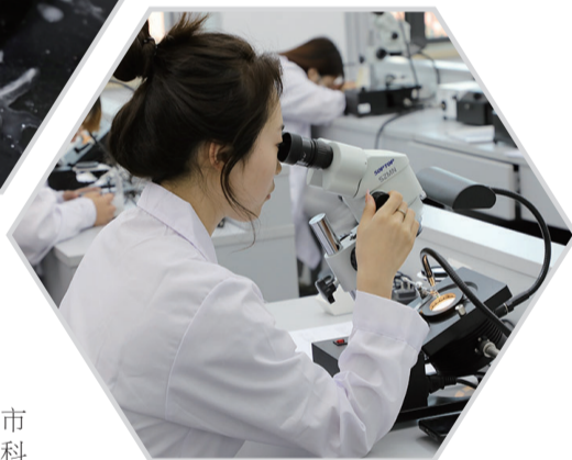
学生认真观察宝石表面和内部特征来鉴别宝石。

共同体的空白。共同体整合21个省市自治区的67家相关院校、政府部门、科研机构、行业组织和代表性企业资源,汇集头部企业优势,中国地质大学(武汉)的科研创新和技术研发优势以及学校的区位优势,为全国珠宝行业信息互通、资源互享、成果互鉴提供了平台,为行业提供有力的人才支撑和智力支持。