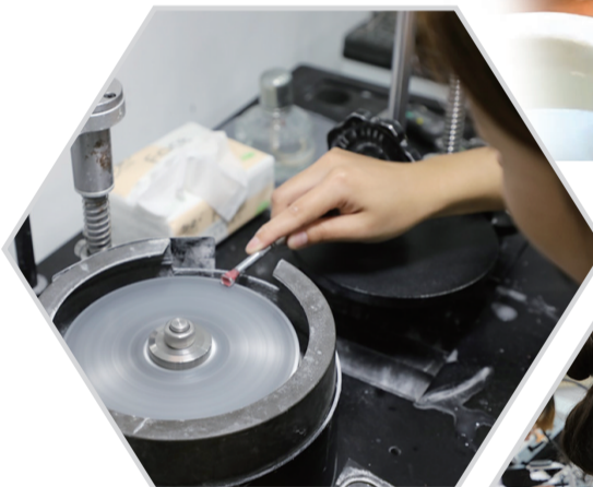
学生用火漆固定宝石,在磨盘上琢磨宝石。