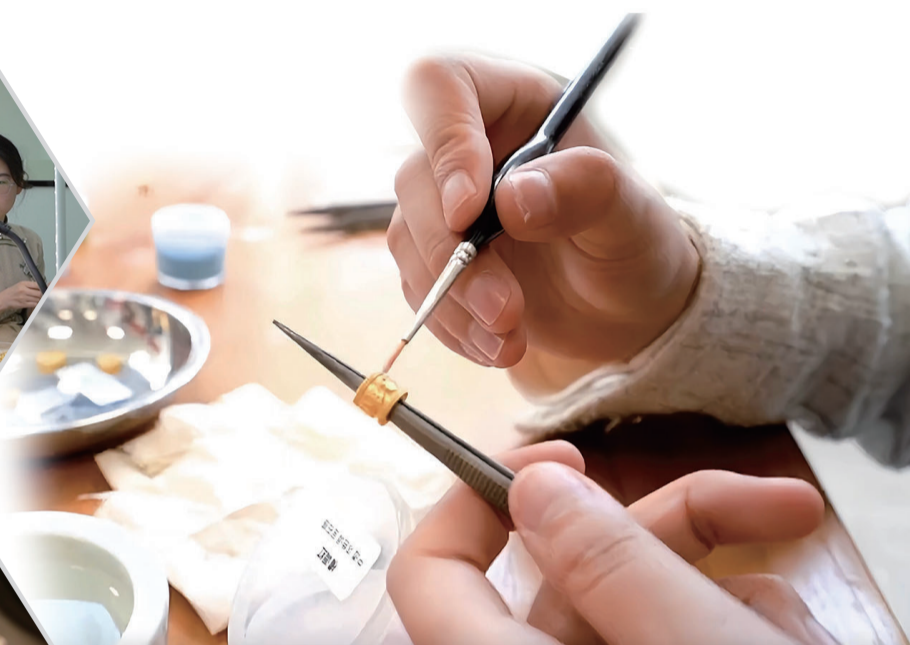
学生正在金属坯胎上填充釉料。

学校推行政府、学校、企业、行业四方合作,与67家政府、学校、企业、行业资源产学研用深度融合,联动开展企业见习实训、就业创业指导、专业证书培训考评合作、技术合作攻关等活动,实现高