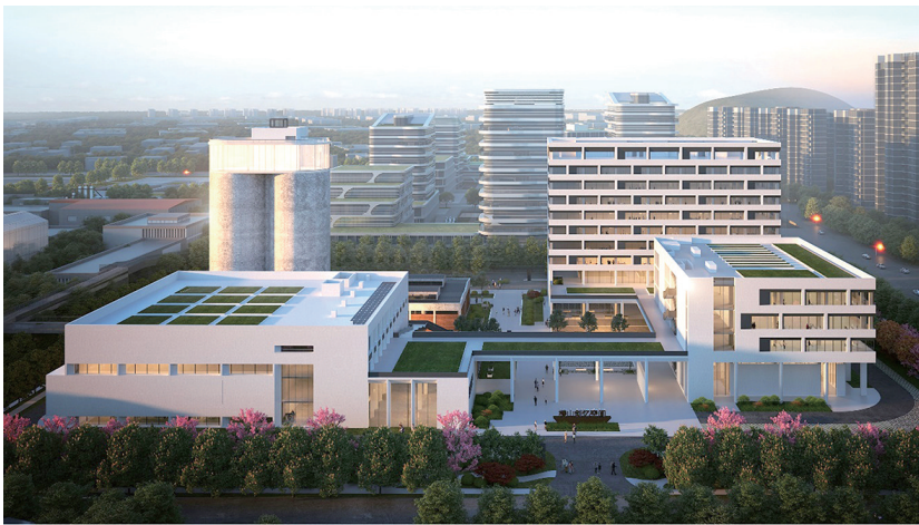
楼山创忆空间项目效果图。