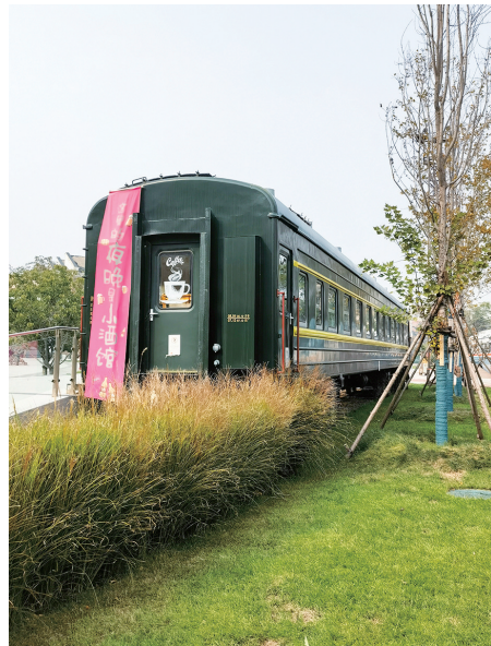
组图：以老四方机厂旧址为基础打造的机车公园。

业示范区，规划引入中车轨道交通装备研发产业，建设新的总部基地、研发中心和智能制造车间。随着这些高端产业的落地，大批高知人才纷至沓来，围绕产业集聚、消费升级的“乘积效应”也将在此爆发，形成特色产业生态圈。整个项目交付后，预计年产值将达100亿元，创造约2万个就业岗位。市北区历史城区管理委员会相关负责人表示，未来，这片曾经低效利用的土地上，将矗立起一座融合产业与城市文化的“新时代工业文明”复兴地标，重新焕发出老四方机厂昔日的辉煌与魅力。