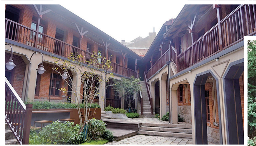
◀里院中的庭院别有“青岛风味”。

位于安徽路16号的青岛小红楼美术馆,前身是一座迄今已有103年历史的德式花园别墅,如今是集美术、书房、咖啡馆和艺术交流于一身的文艺休闲场所。走进小红楼美术馆,记者看到这里