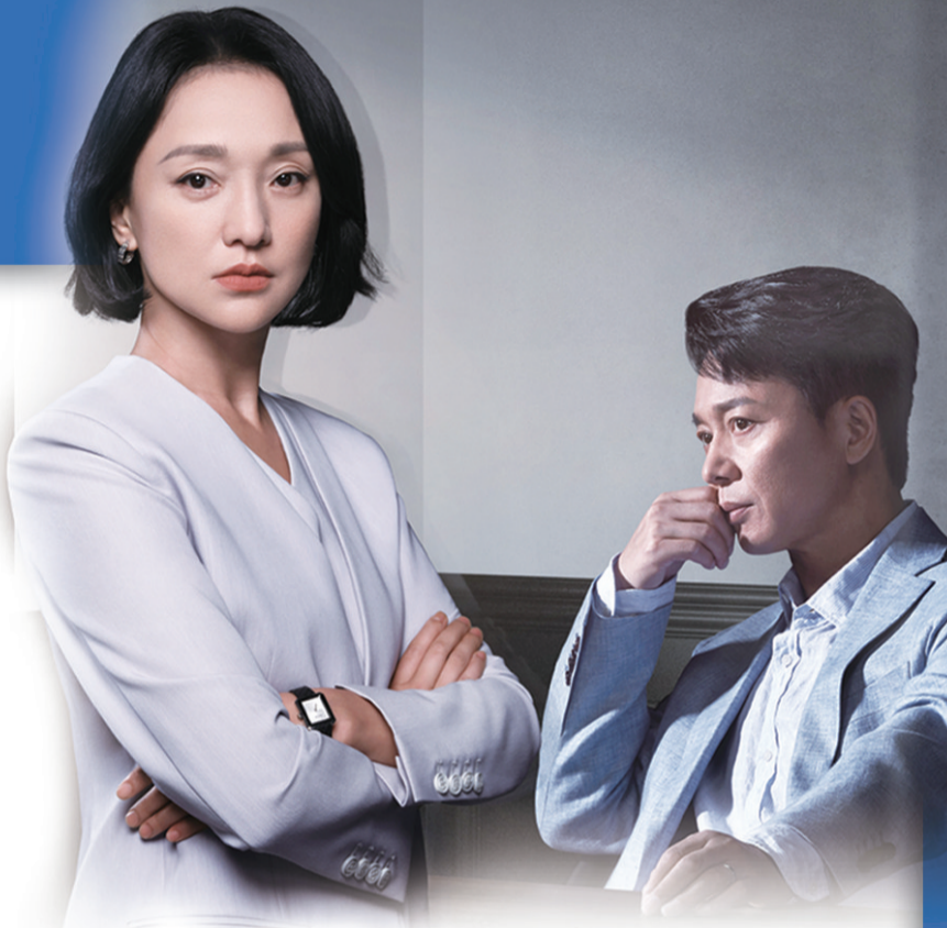
《不完美好受害人》海报

相信伴随着“飞天奖”“星光奖”的评选,这些优质剧集在首轮播出档期之外将再度受到关注,而青岛作为这些剧作的拍摄地,不论是融入剧情氛围的城市风貌,还是在东方影都摄影棚里还原、搭建的场景,都将展示着青岛这座影视之城日新月异的发展速度。影视产业之都的建设正以全新的风貌亮相并惊艳众人。