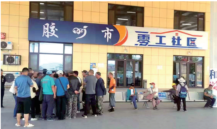
胶州市零工社区。

之家”和 248 个基层“就享家”乐业服务站，总占地面积超过 6 万平方米，年发布招聘岗位 40 万个，服务求职者超过 200 万人次。