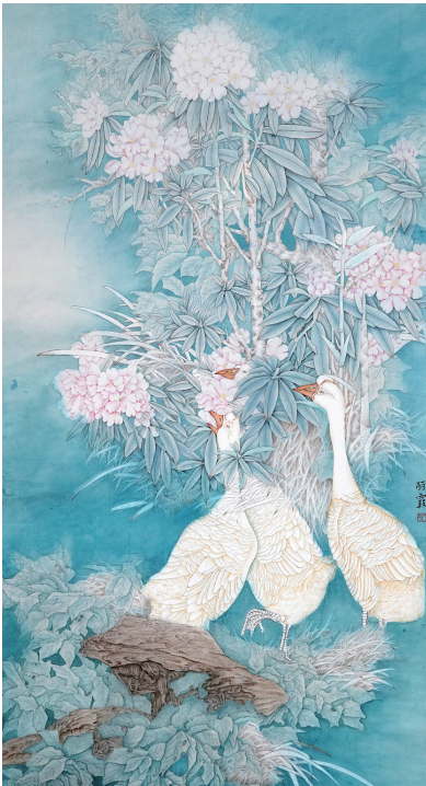
绘画 于丽霞 市老年大学