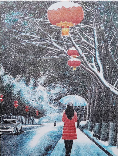
钢笔画 徐光亮 市老年大学