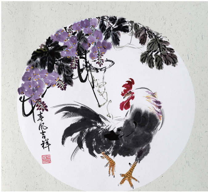
绘画 周洪森 市老年大学