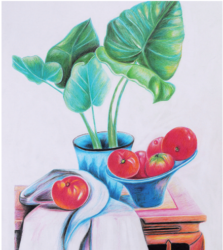
绘画 周树华 市老年大学