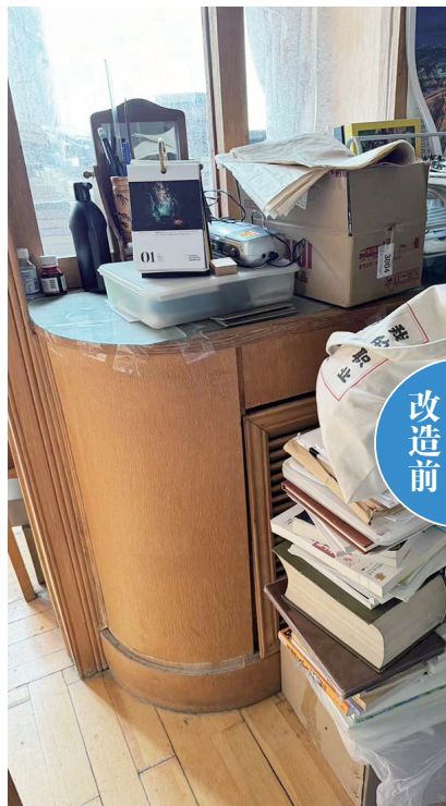
王阿姨家客厅储物杂乱。

为响应国家以旧换新政策,由青岛早报联合东方家园共同打造的“爱家焕新”活动正在进行中。目前,已有近百位市民报名参加,其中不少是因为家里设施过于陈旧,有的是随着时间推移,原有住房让老年人感到生活上有诸多不便。面对众多希望翻新的老房子,东方家园全案高级设计师谢文琼从最新的居住理念出发,为参与活动的业主提供最新的改造方案。通过对参与活动老房子的实地考察,设计师总结出了很多改造案例。