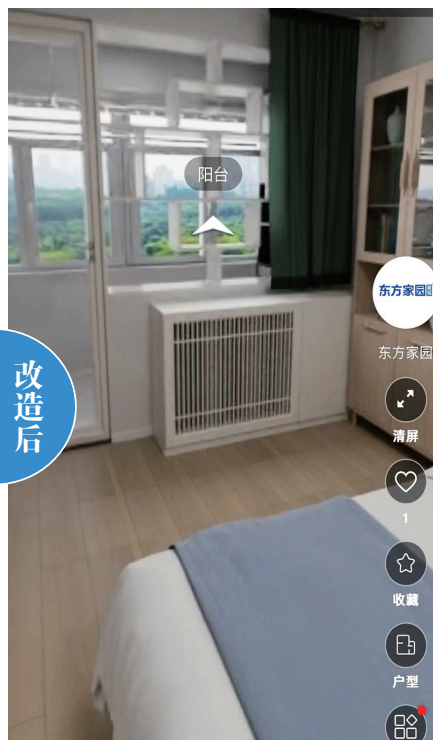
设计师改造后效果图。